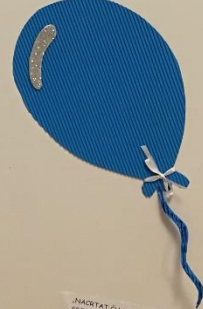
„NAKUPATI OJ MU TORTU, ŽELIM MU SREĆAN ROĐENDAN“ (T. T.)