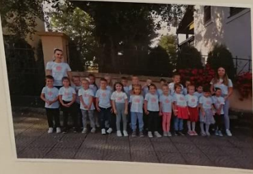
„JUNO LUBAVI I DA BIJE ŽUBAV“ (J. V.)